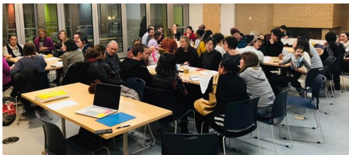
January PTO meeting

At this meeting we had an impressive showing of families and teachers from across our diverse community. It was a wonderful start to this conversation about how the PTO operates, new family engagement, and how to move forward. We will give an update on the valuable input we received and continue this important conversation at our February 28 meeting at 5:30 PM in the living room. We hope you will join us.